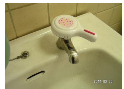
〈節水のための水道蛇口カバー〉